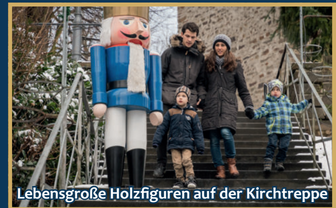
Lebensgroße Holzfiguren auf der Kirchentreppe