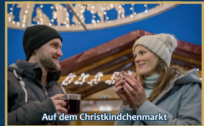
Auf dem Christkindchenmarkt

Regionale Musikvereine, Solisten und DJs sorgen für Unterhaltung.